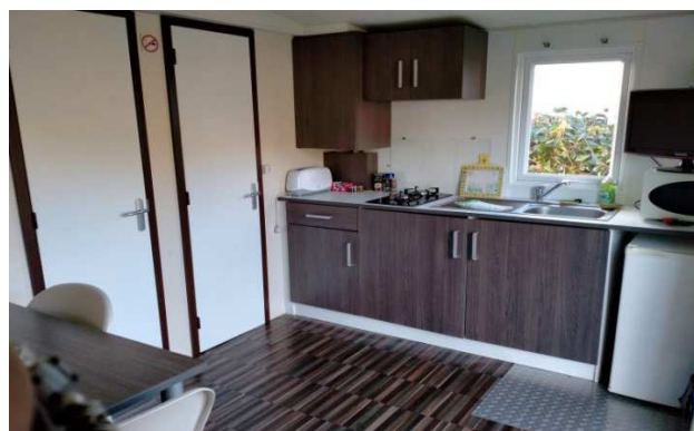
Ce mobil home se trouve emplacement 42 et 37

Une terrasse en bois vous permet de profiter du salon de jardin et vous pouvez garer votre voiture sur une place de parking à côté du mobil home